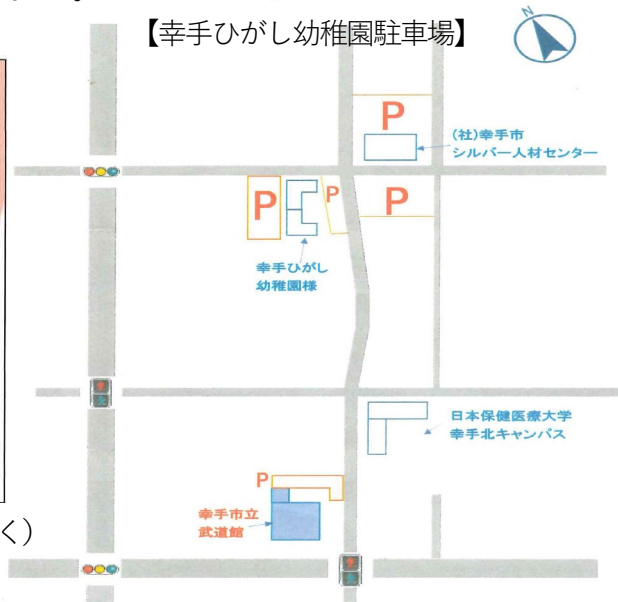
【幸手ひがし幼稚園駐車場】